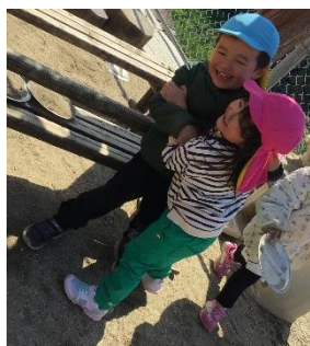
お友だちと一緒に 遊ぶのも大好き♡