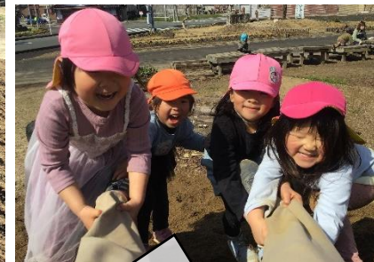
先生を引っ張るぞ!