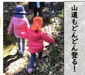
山道もどんどん登る!