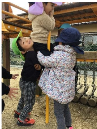
お友だち大好き!思いやり の気持ちがいっぱい♡