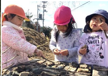
木と石でバーベキュー