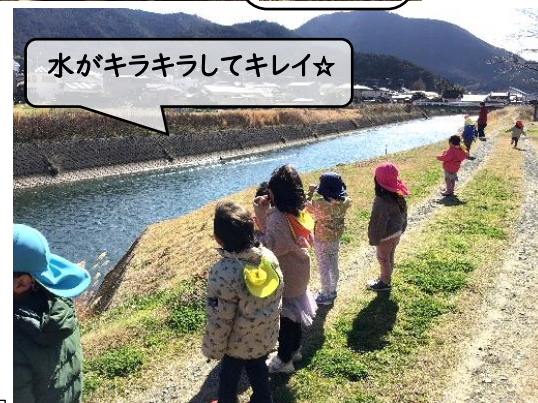
水がキラキラしてキレイ☆